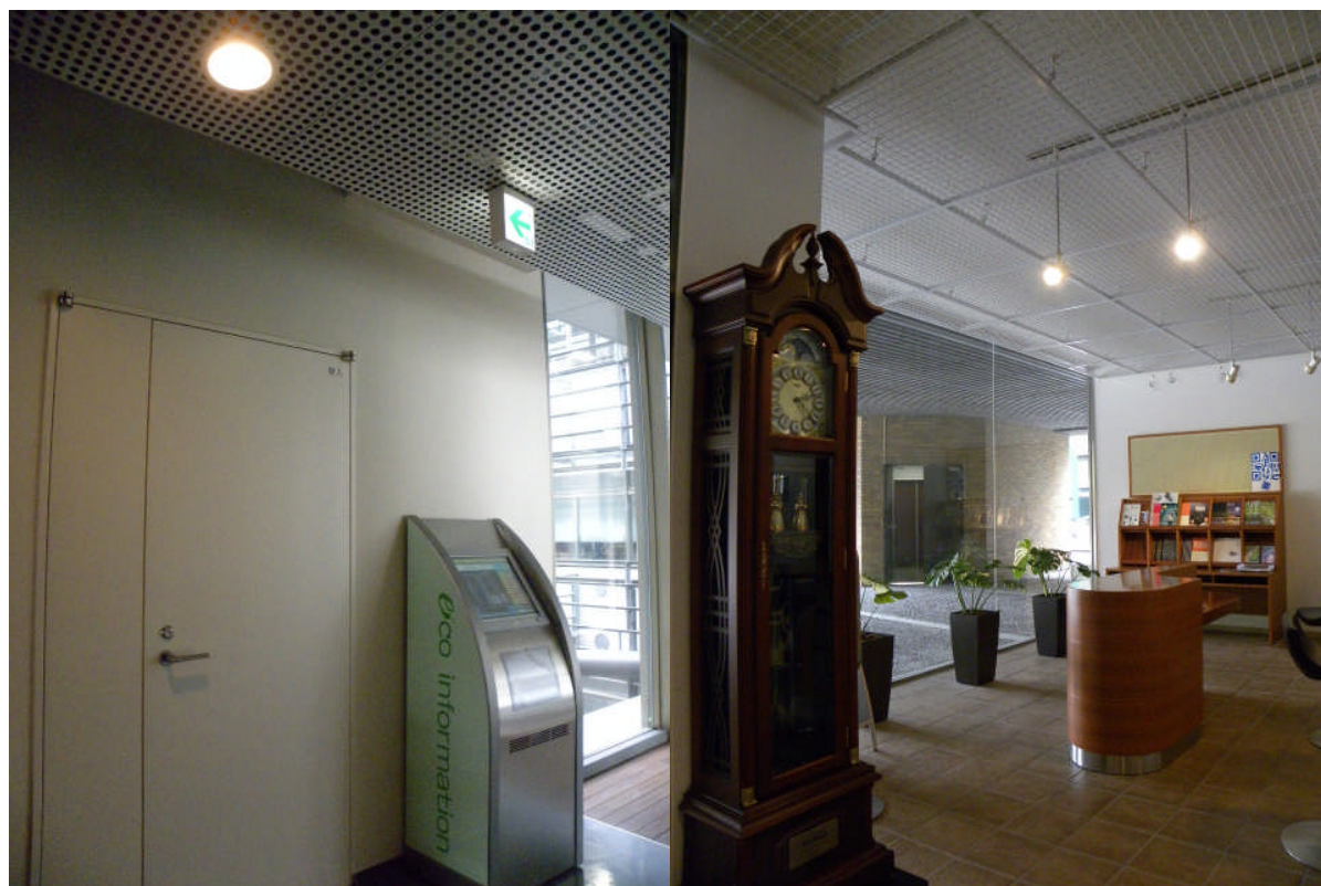
工学部 2 号館に導入された LED 照明

今後 GUTP は、これまでの成果を市場で活用できるファシリティマネジメントシステムとして体系化します。そして参画企業と連携を強化し、大塚商会を通じて企業や学校、自治体への普及につとめます。